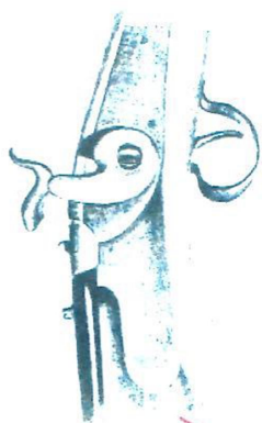
Detal broni palnej.

Wszystkie wymiary podane w centymetrach.