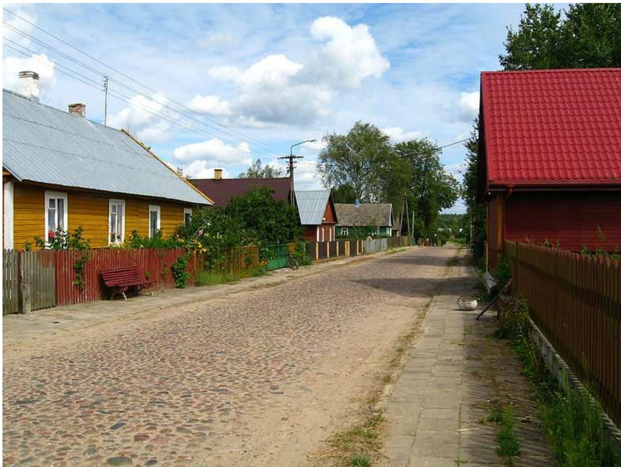
Droga powiatowa biegnąca przez wieś.