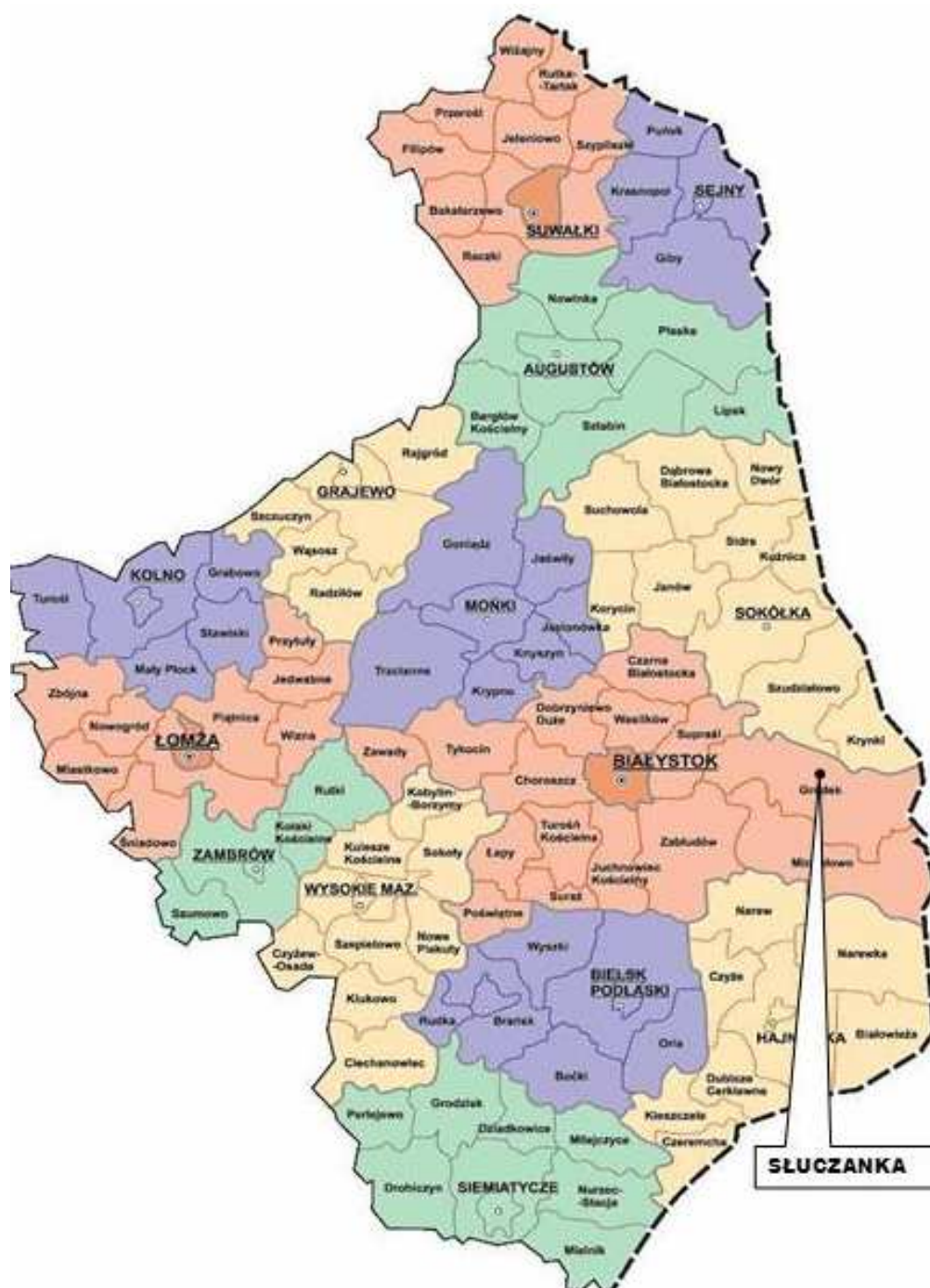
Lokalizacja wsi Słuczanka w województwie podlaskim